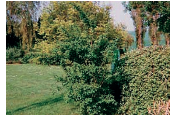
...dissimulée par le feuillage, l'antenne se fond dans le décor ! (installation réalisée dans l'Yonne)