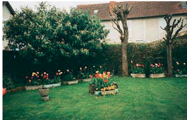
De loin, on ne voit rien...