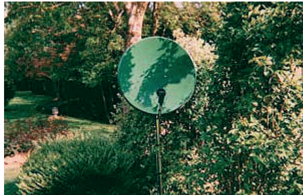
Installée sur un mât au fond du jardin...