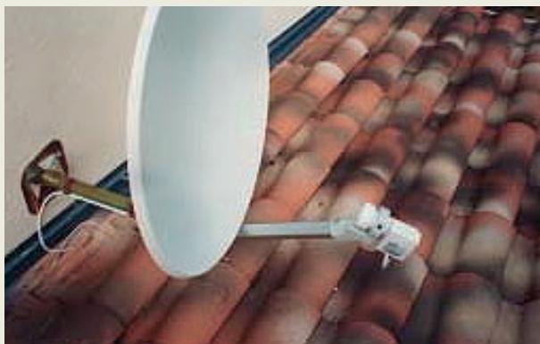
L'antenne, de la couleur du crépi, a donc été installée entre deux niveaux de toiture.

sur un site classé, l'installation est réglementée