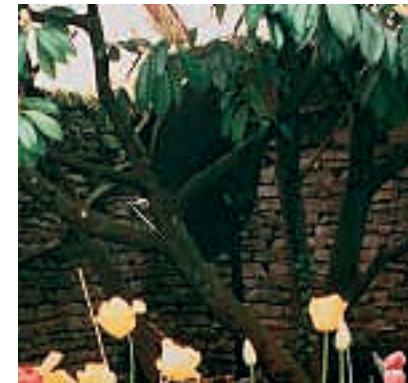
De près, ça reste très discret ! (installation réalisée en Haute-Marne)